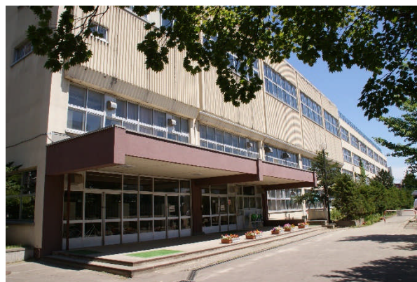
旧校舎の様子(2016年撮影)

中央中学校としての授業は1969年(昭和44年)4月7日に開始されました。2017年(平成29年)まで使われた校舎は当時、北海道でも有数の施設・設備を誇り、開校当時は29学級1,299名の生徒が在籍する大規模校でした。